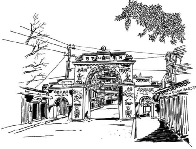
अबु यलय् वन।