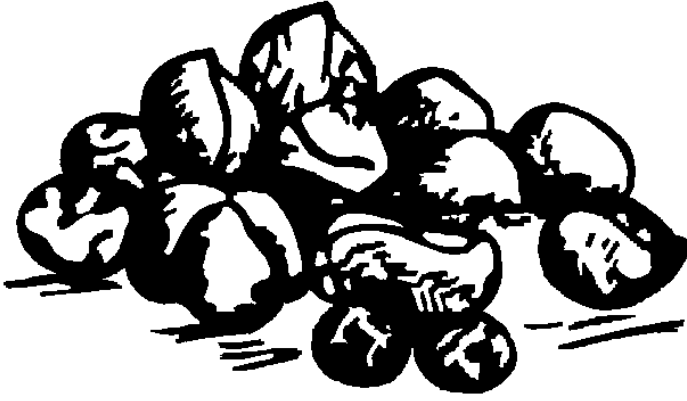
काँकडो ओखणकी खानी