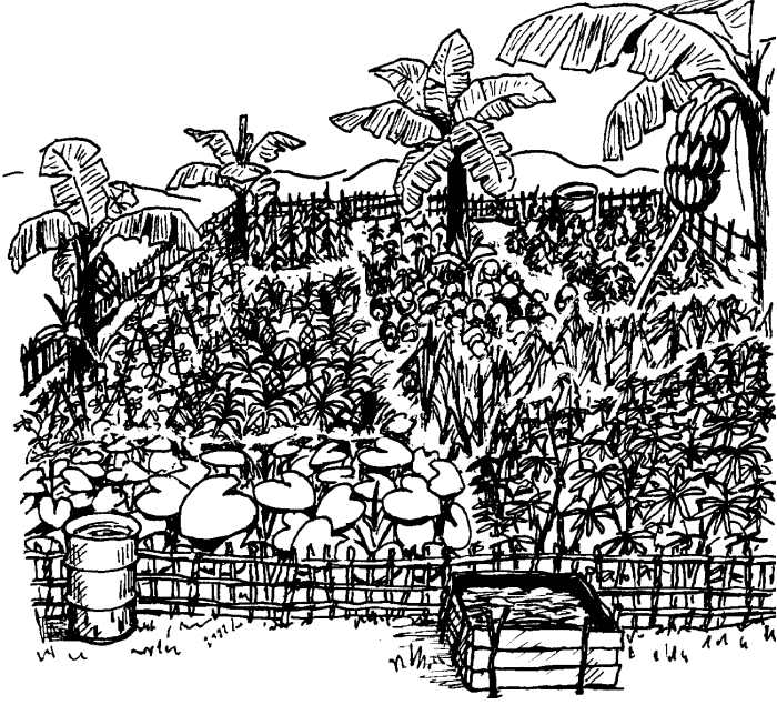
बगइचा घन बा।