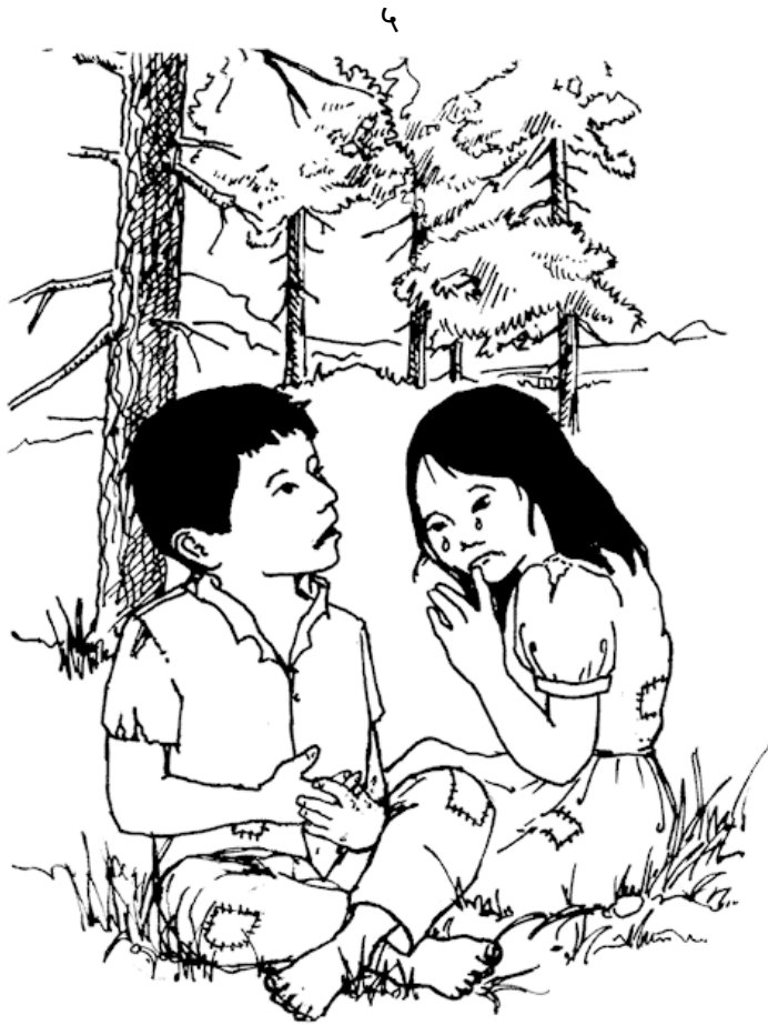
ददी और लडका