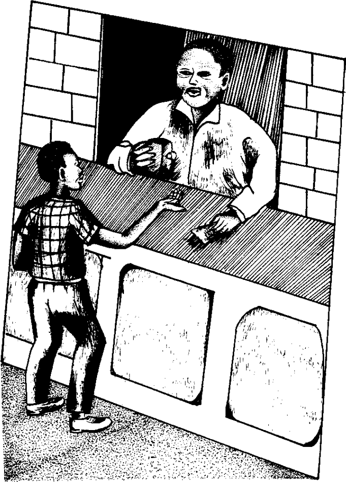
घर, लडका, दुकान