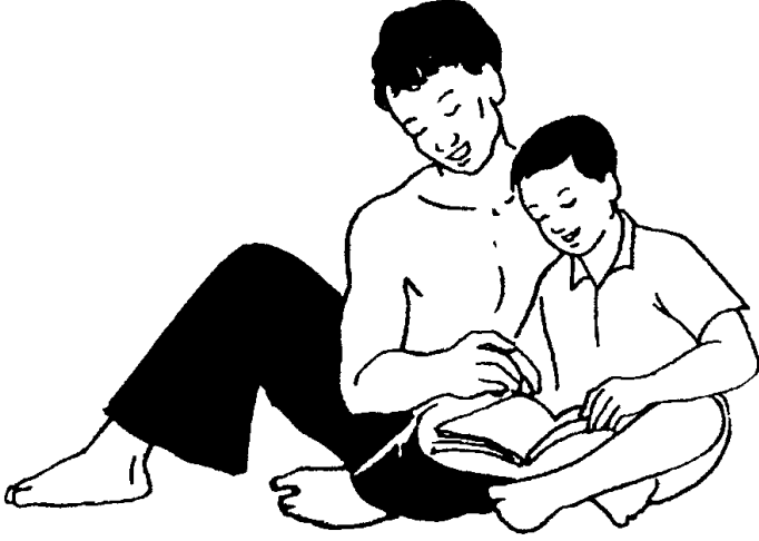
चाचा, लडका, कतिब