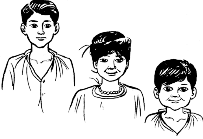
चाची, जजिा, लडका