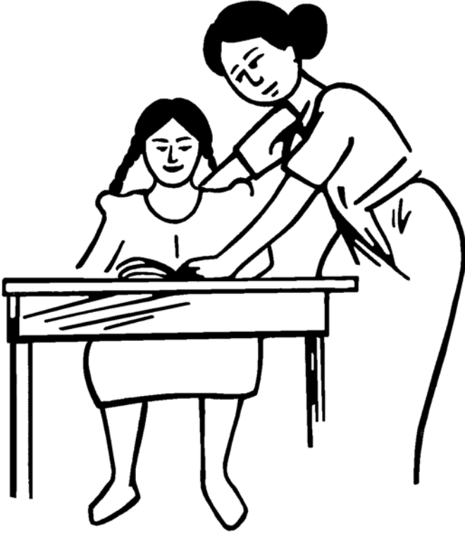
ददी और लीला