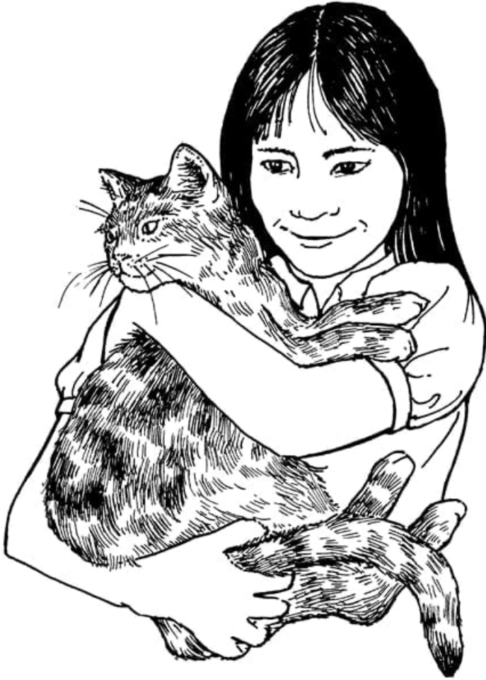
ददी और बलार