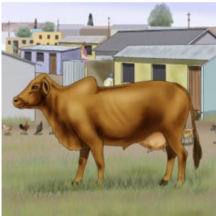
Este es Pendo.